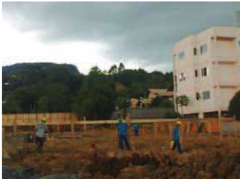
Execução do Gabarito