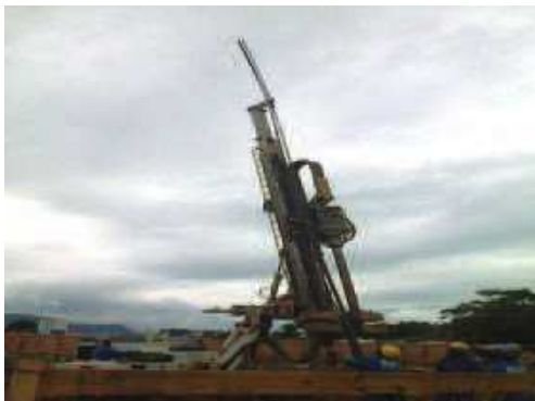
Colocação da Ferragem