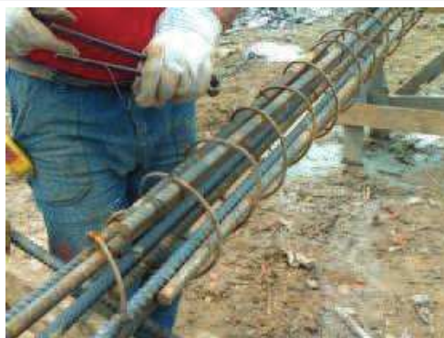
Execução das estacas