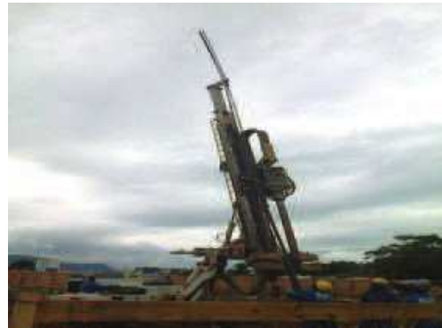
Colocando a ferragem;