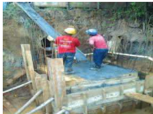
Caixa de passagem (entrada)