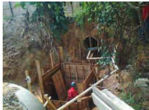
Caixa de passagem (Entrada)