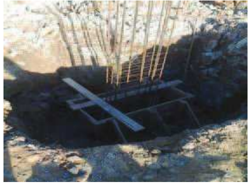
Pilar do baldrame