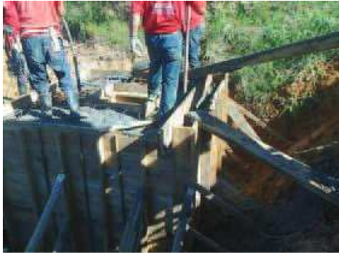
Concretagem da caixa de passagem