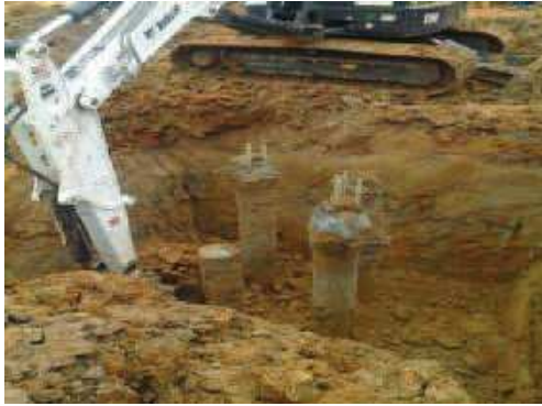
Bloco das estacas