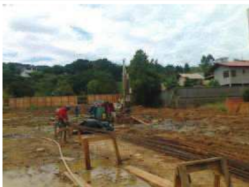
Execução das estacas