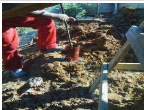
Amostra do concreto da caixa de passagem