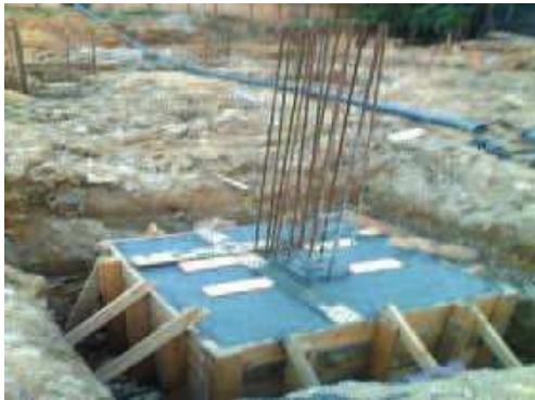
Pilar do baldrame