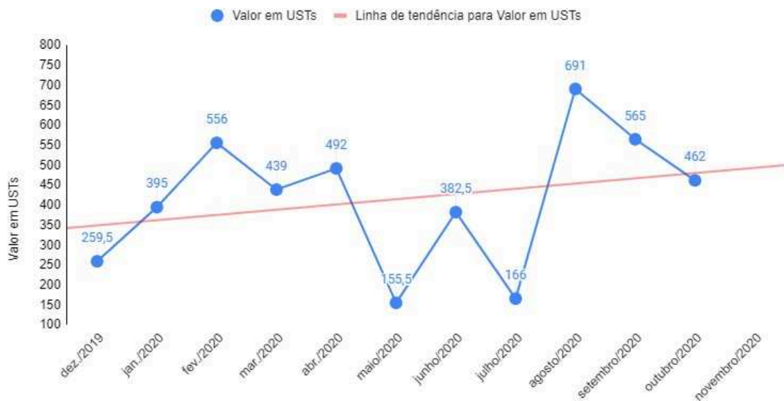
Produtividade mensal por USTs

O gráfico acima apresenta a produtividade acumulada das Ordens de Serviço que foram finalizadas em cada mês. É importante ressaltar que o tamanho das Sprints vinculadas a cada ordem de serviço variaram de 2 a 3 semanas, o que explica produtividades acumuladas maior em alguns meses. Por outro lado, observa-se também uma certa oscilação da produtividade ao longo do período. Esta oscilação está diretamente relacionada com a complexidade das demandas desenvolvidas naquele período e com a experiência do time de desenvolvimento nos sistemas a elas relacionados. Quanto mais