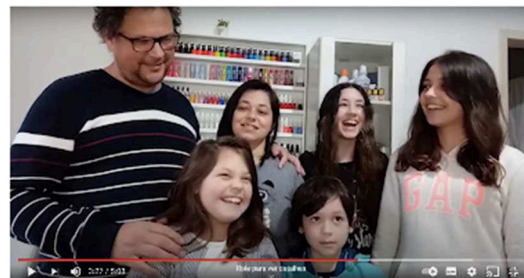
Imagem de vídeo gravado: