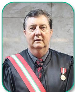
Desembargador Nivaldo Stankiewicz Corregedor-Regional

Aos nove dias do mês de maio do ano de dois mil e vinte e três, o Excelentíssimo Desembargador do Trabalho Corregedor-Regional Nivaldo Stankiewicz esteve no Setor de Apoio à Gestão Administrativa do Foro Trabalhista e Central de Mandados de Chapecó-SC, para a realização da Correição Ordinária objeto do Edital de Correição n.º 4/2023, disponibilizado no DEJT e no portal da Corregedoria em 27-4-2023.