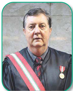
Desembargador Nivaldo Stankiewicz Corregedor-Regional

Ao primeiro dia do mês de junho do ano de dois mil e vinte e três, o Excelentíssimo Desembargador do Trabalho Corregedor-Regional Nivaldo Stankiewicz esteve no Setor de Apoio à Gestão Administrativa do Foro Trabalhista e Central de Mandados de Brusque-SC, para a realização da Correição Ordinária objeto do Edital de Correição n.º 4/2023, disponibilizado no DEJT e no portal da Corregedoria em 27-4-2023.